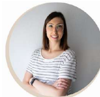
LAURA BELLVER COMUNICACIÓN