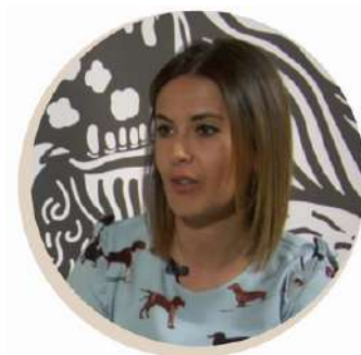
CRISTINA VIVÓ PRODUCCIÓN