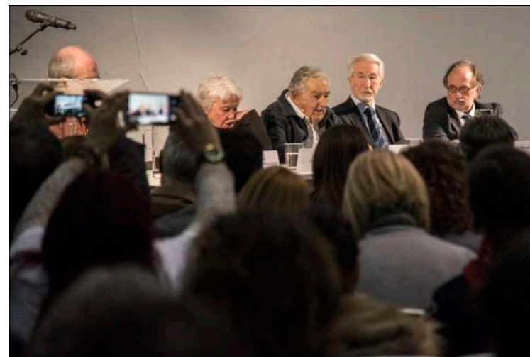
Col·loqui amb Pepe Mujica El futur dels drets humans , organitzat per l' Humans Fest el 6 de febrer de 2020 al CCCC.

Amb dades de 22 de maig de 2020 i tenint en compte que han passat menys de tres mesos des de l'inici de l'edició de 2021, amb l'audiència en línia i presencial, l' Humans Fest supera àmpliament a la resta de festivals de drets humans celebrats a Espanya d'una banda pel fet de ser un festival que se celebra durant tot l'any i d'altra banda per haver augmentat la seua oferta en línia durant l'estat d'alarma a causa de la Covid-19. Una oferta que es mantindrà després durant la resta de l'any .